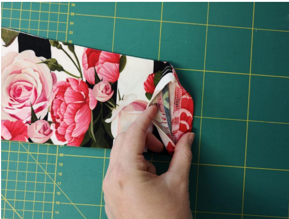
29. Já šila na coverlocku