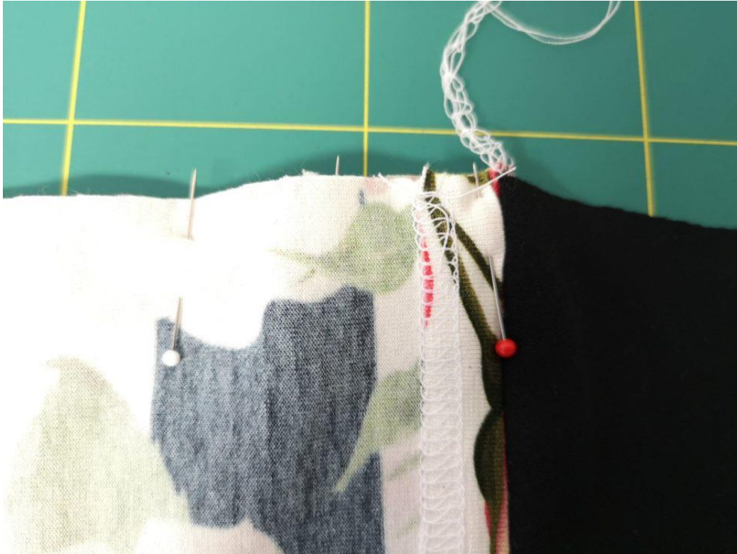
17. Dolní kraj ZD našpendlíme až ke švu s našitým tílkovým dílem