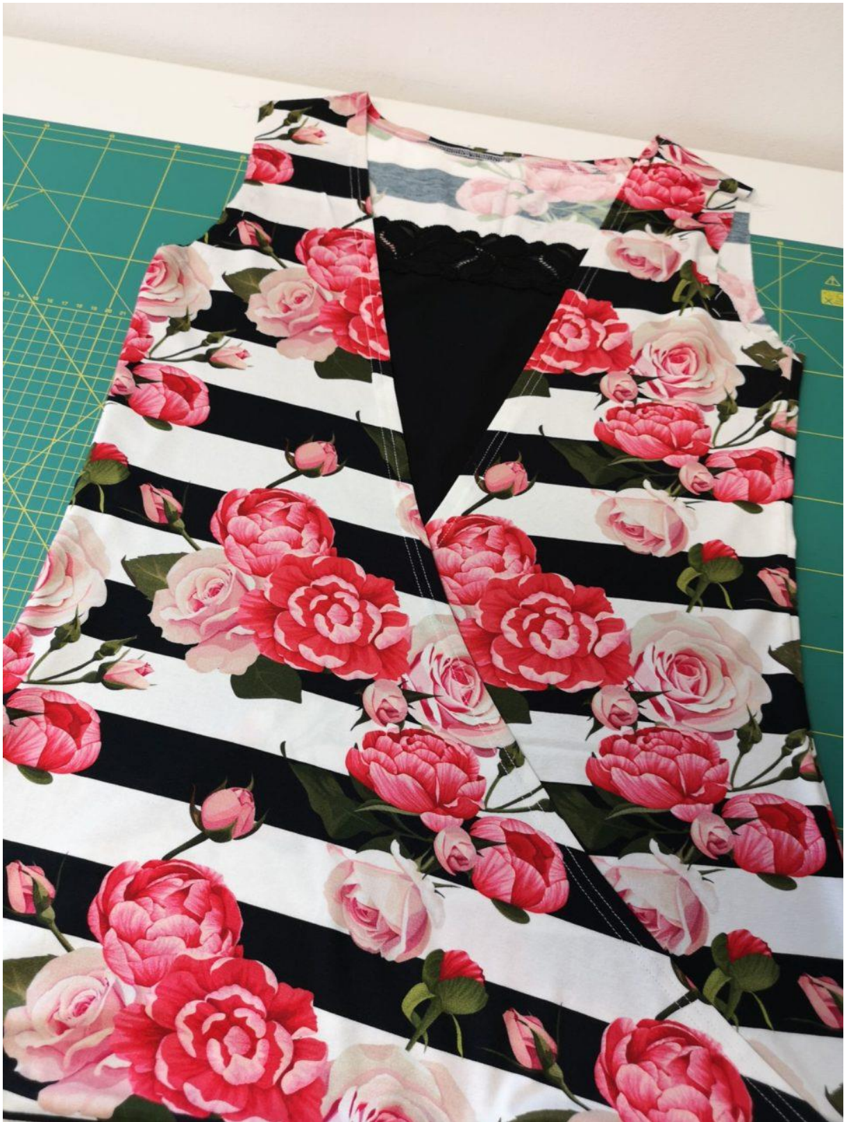
25. A Trupovou část trička máme připravenou na vsívání rukávů.