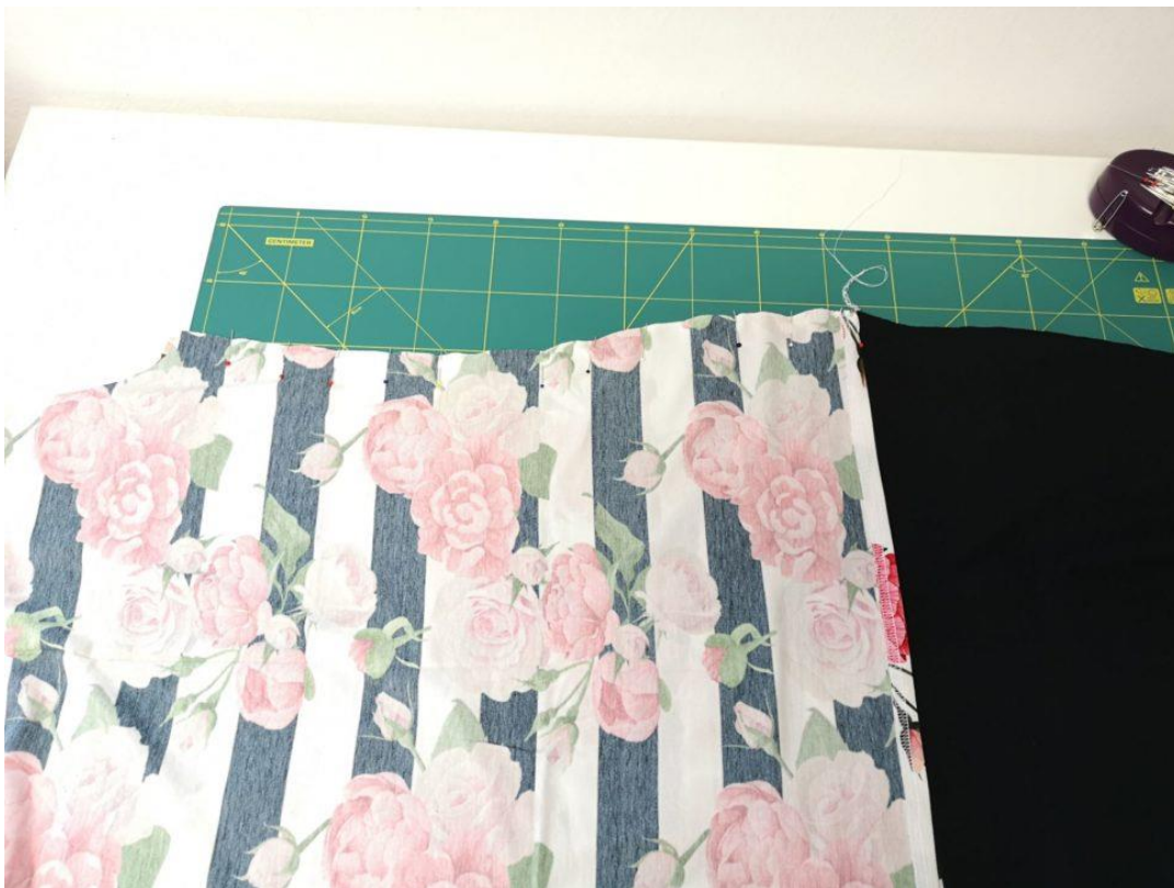
16. Přes PD trička položíme LS k LS ZD trička a sešpendlíme boční šev.