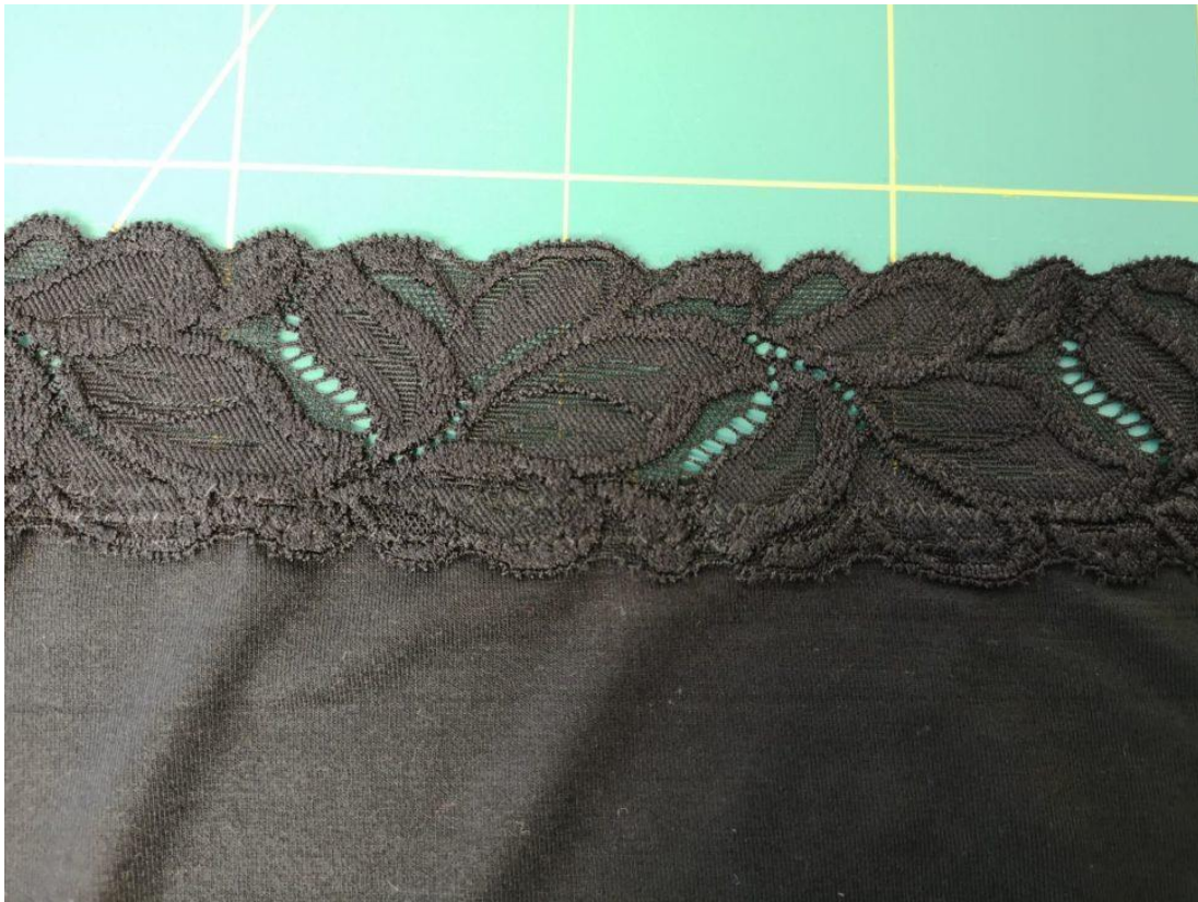
5. Detail našití