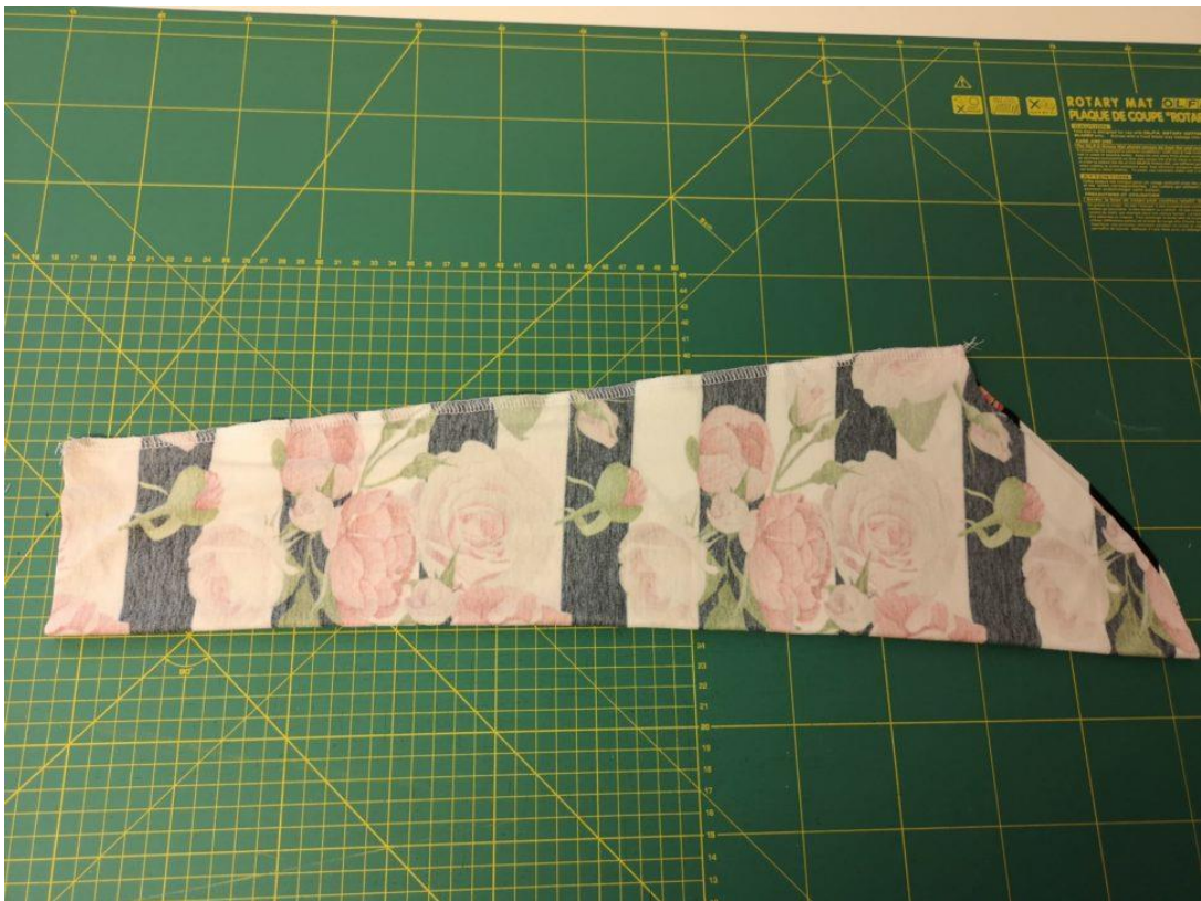
27. A sešijeme