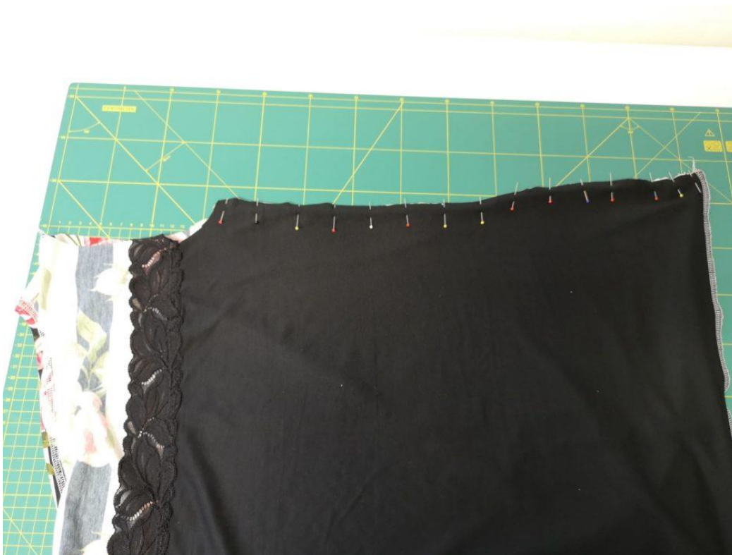
18. Přes našpendlený boční šev otočíme ještě tílkový díl a znovu našpendlíme boční švy (ty tak mají tři vrstvy)