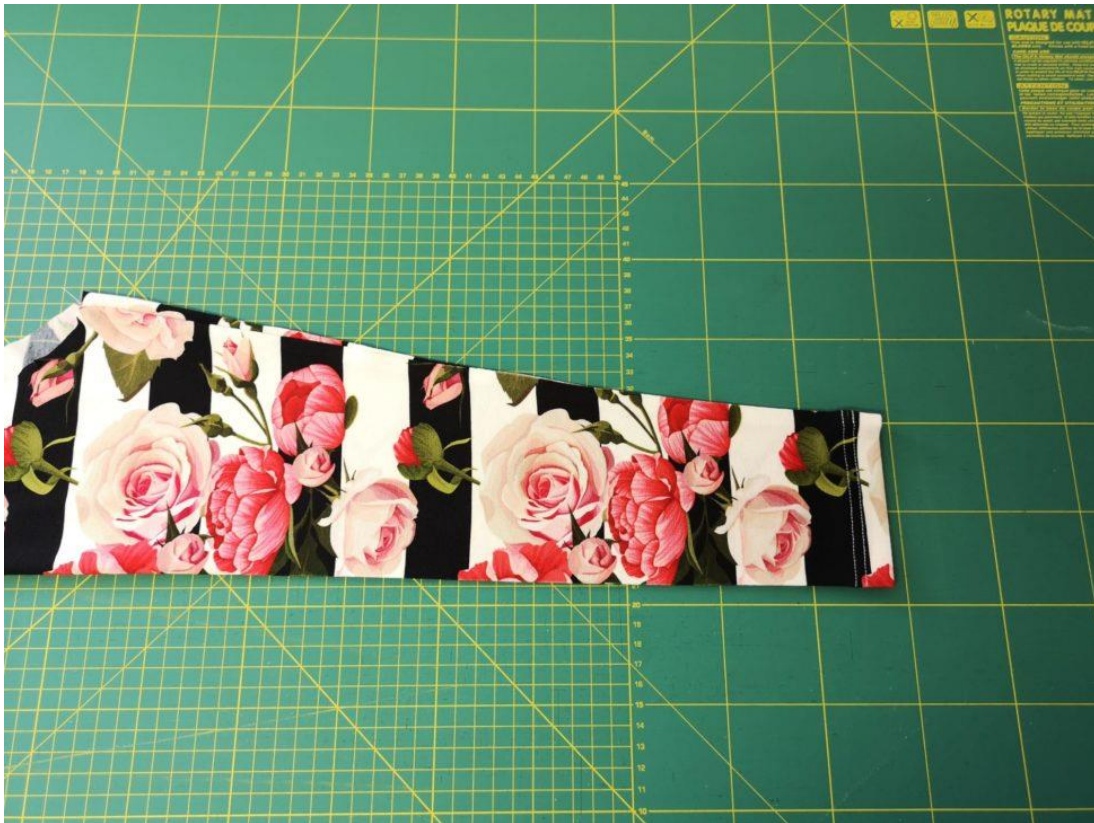
28. Dolní kraj rukávu zahneme a prošijeme