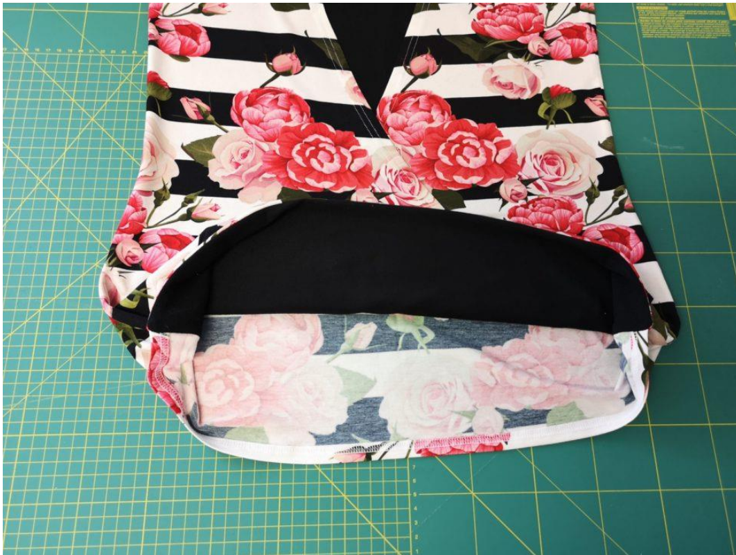
23. Takto už vypadá hotový dolní kraj trička