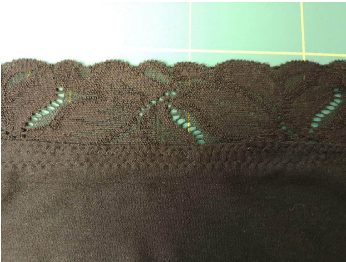
6. Z RS pak přesahující materiál zastříhneme těsně u našití.