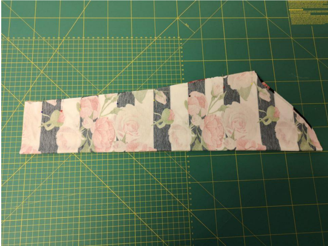
26. Rukávy sešpendlíme